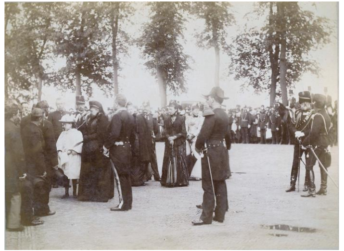
De jonge koningin Wilhelmina en regentes Emma bezoeken Werkmanslust.

't Is liefde tot den werkmansstand. Vorstin wij kusten U de hand Hield eerbied ons niet tegen."