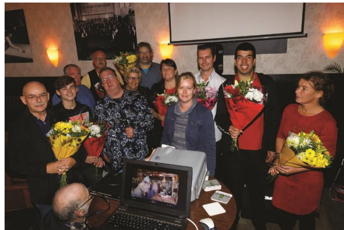
Cast en crew van 'Jurjen' in de bloemetjes gezet bij de Friesche Club.

vanderbrughenk@gmail.com Telefoon: 06 199 39 460